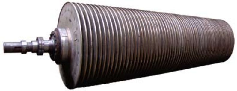
Eixo do Discor com os discos rotativos.